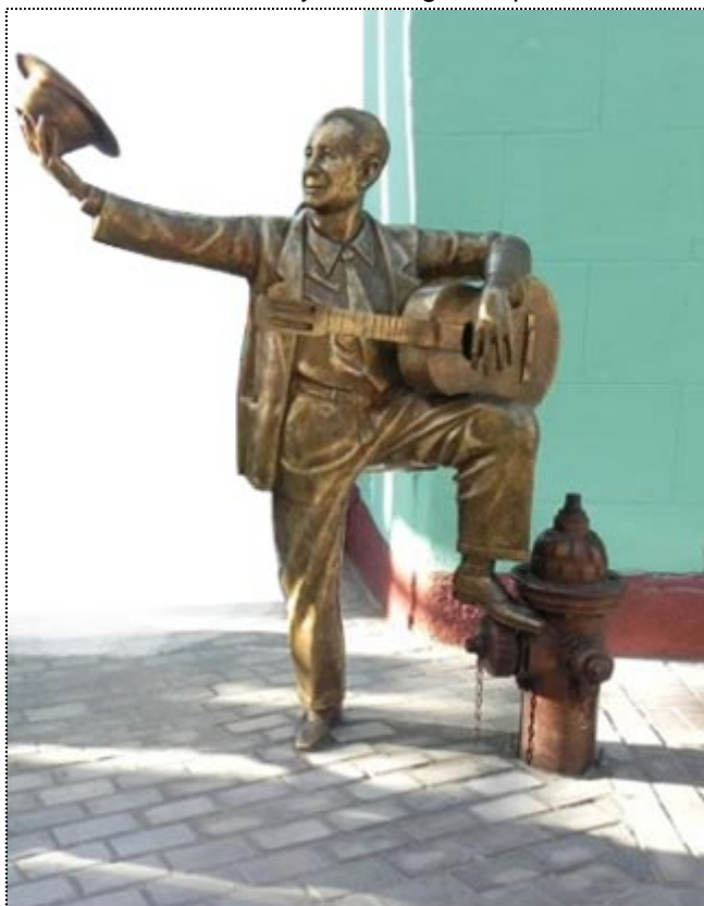
Monumento a Miguel Matamoros en Santiago de Cuba

Pero resulta que yo conocía a un billettero de la plaza del Vapor, llamado